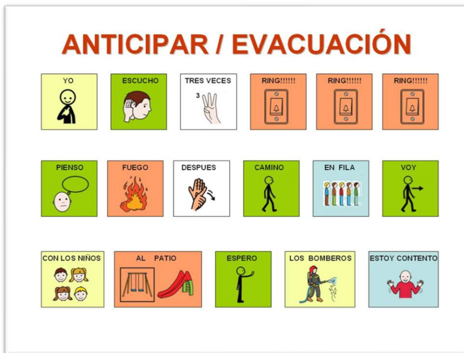
Ejemplo pictograma evacuación sismo.